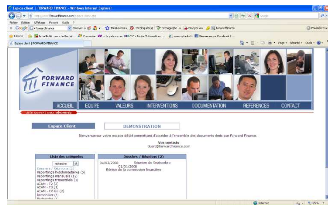
Plate-Forme sécurisée d'échanges clients